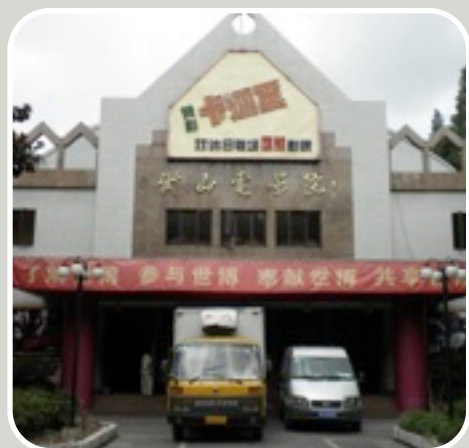
衡山影院的改造工程已经开始。门口的卡车正在装运从影院内拆卸下来的设备和装备。

衡山路长约2.3公里，是当时的法国警察局于1922年修建的。它的原名叫“贝丹路”，直到1943年10月才改